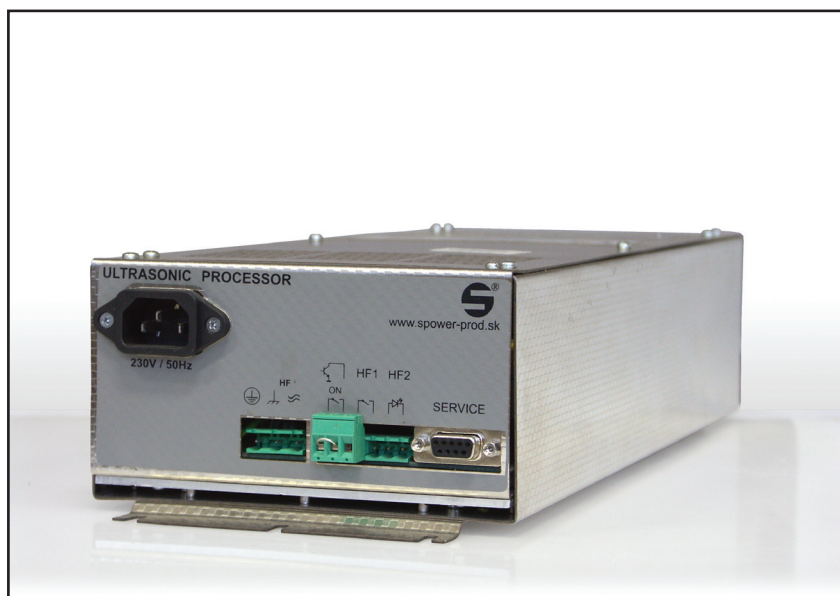
Ultrazvukový generátor UP03

Predný panel obsahuje päť signalizačných LED a potenciometer, ktorým je možné regulovať výkon ultrazvukového generátora na výstupe.