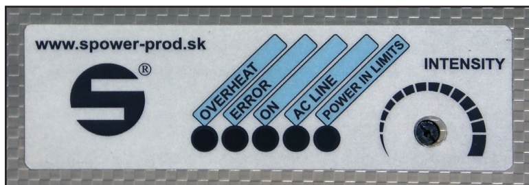
Predný panel so signalizačnými LED

Predný panel obsahuje päť signalizačných LED a potenciometer, ktorým je možné regulovať výkon ultrazvukového generátora na výstupe.